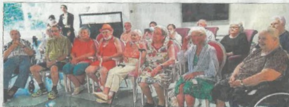
Les pensionnaires de la Résidence autonomie ont bien participé au spectacle.

Deux jeunes comédiennes de la Compagnie de théâtre "En Mauvaise Compagnie" sont venues présenter en avant-première aux personnes de la résidence "La Pousterle" une pièce de théâtre sur le thème de la souffrance au travail. Elles souhaitent recueillir l'avis des résidents sur cette comédie burlesque et effrénée avant