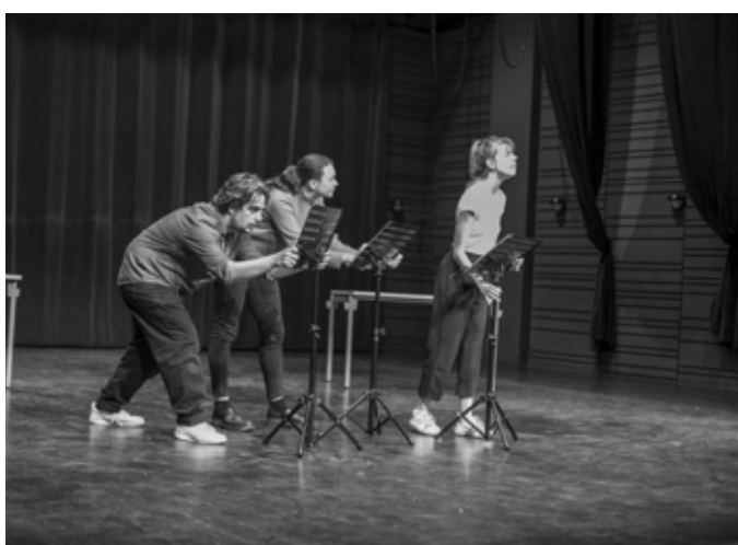
Sortie de résidence - La bascule - Communauté de Communes Dômes Sancy Artense

Mise en corps : Travail sur les archétypes, la gestuelle mécanique et l'écriture du mouvement