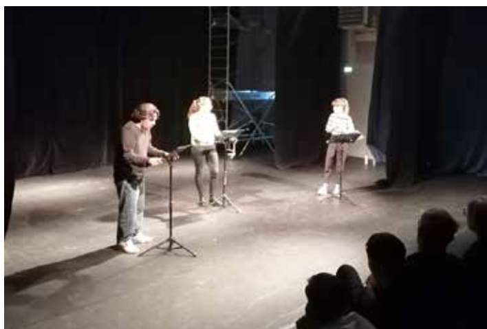
Sortie de résidence - Les abattoirs - Riom