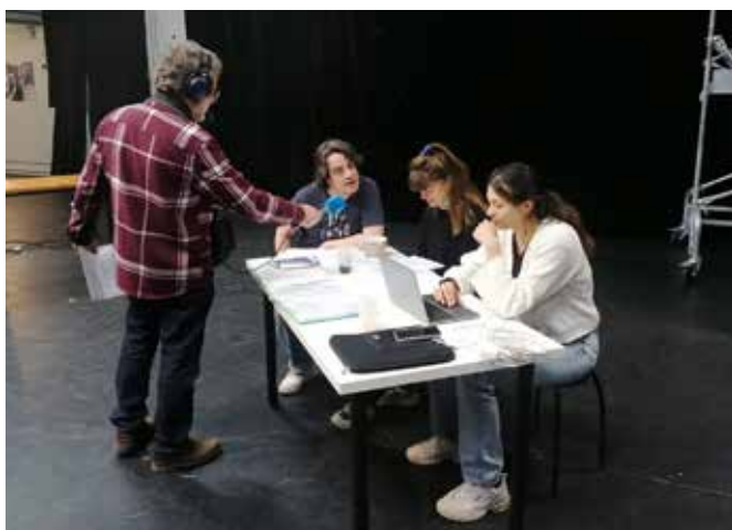
Lecture jouée - Interview France Bleu Auvergne

Pratique et recherche en équipe sur le texte, travail en lecture au plateau. Réflexions en équipe sur les personnages et sur l'issue possible de la pièce. Lecture radio - France Bleu Auvergne. Sortie de résidence en présence d'un quarantaine de personnes, bord plateau et retours public sur la compréhension du texte et de ses enjeux.